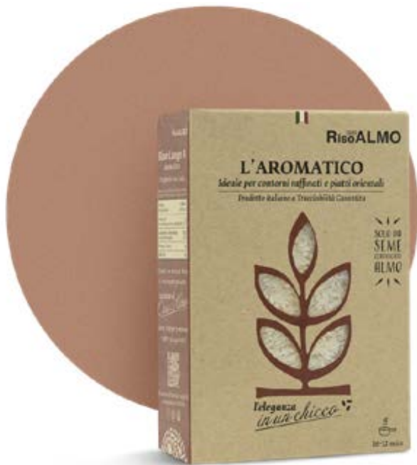
○ ————— aromatico ————— ○