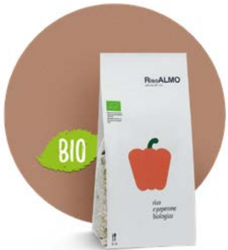
— peperone biologico — organic pepper