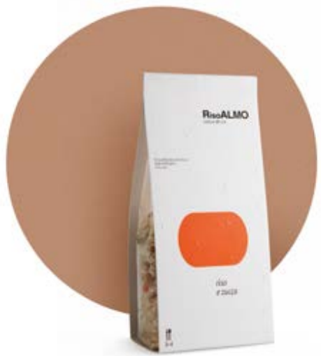
— zucca — pumpkin