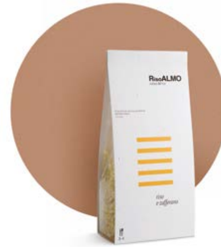
— zafferano — saffron