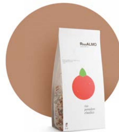
— pomodoro e basilico — tomato and basil