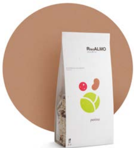
— panissa — panissa