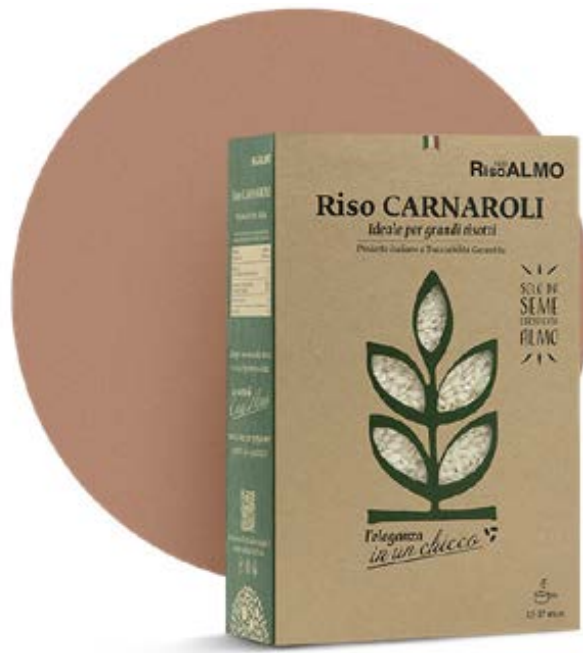
○ ————— carnaroli ————— ○