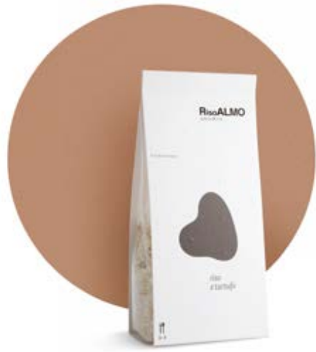
— tartufo nero — black truffle