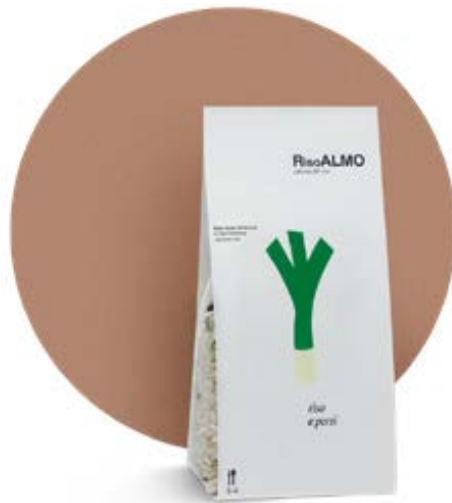
— porri — leeks