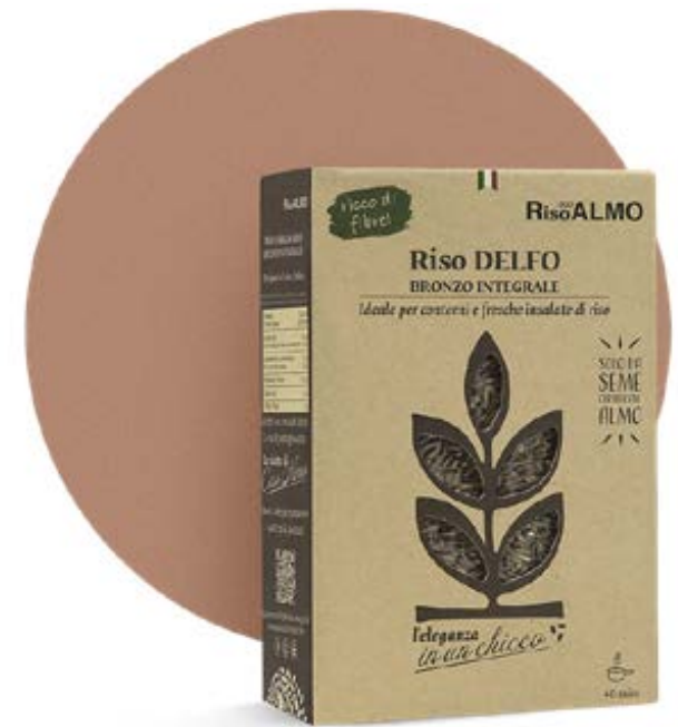
○ ————— delfo ————— ○