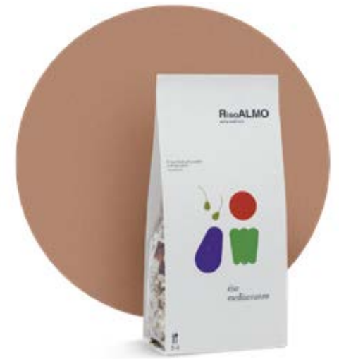
— mediterraneo — mediterranean