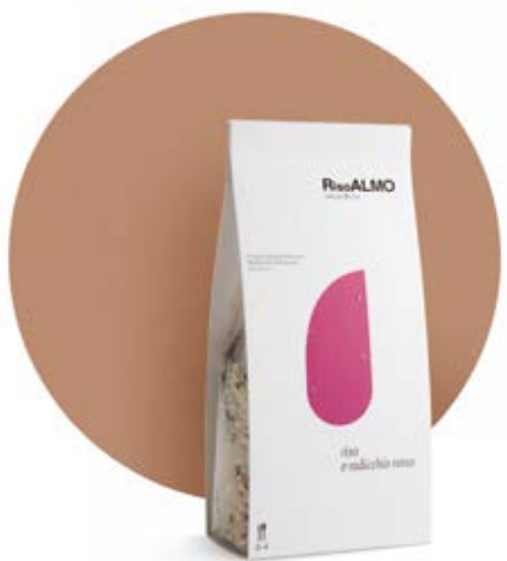
— radicchio rosso — red chicory