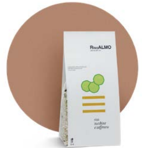
— zucchine e zafferano — zucchini and saffron