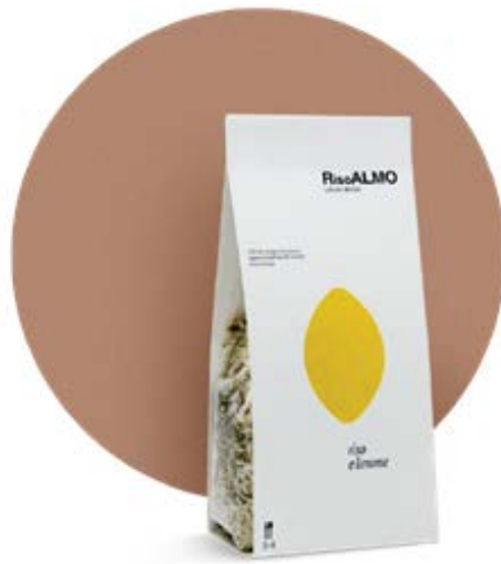
— limone — lemon