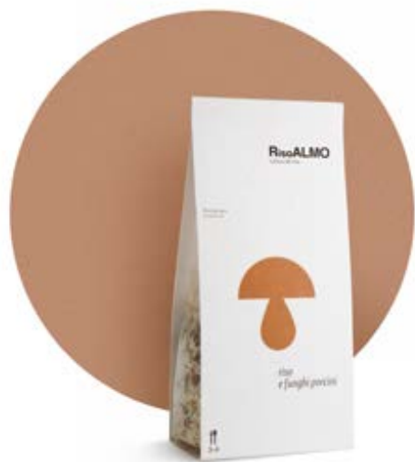
— funghi porcini — porcini mushrooms