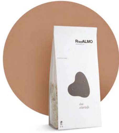
— tartufo nero — black truffle