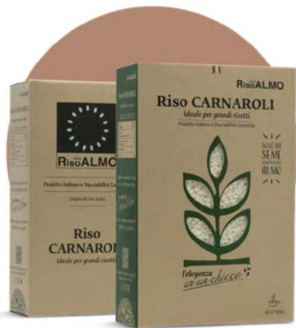
○ ————— carnaroli ————— ○