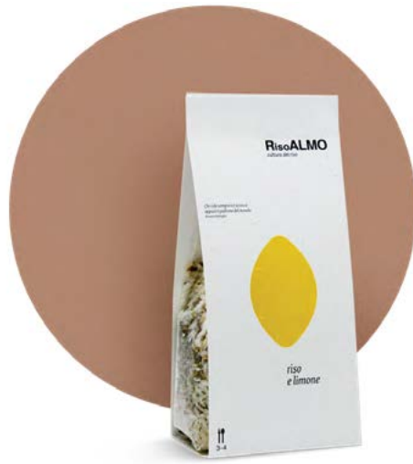
— limone — lemon