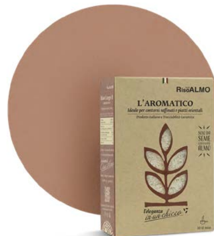
○ ————— aromatico ————— ○