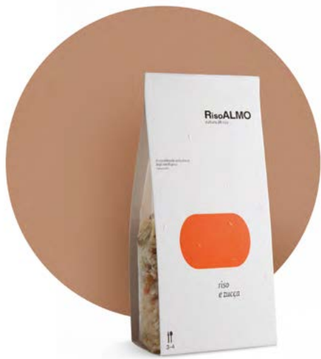
— zucca — pumpkin