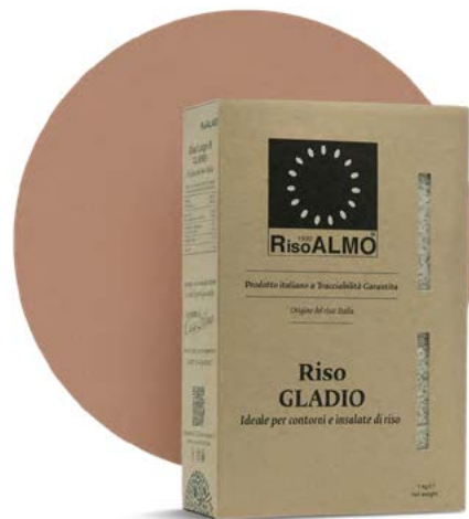
○ ————— gladio ————— ○