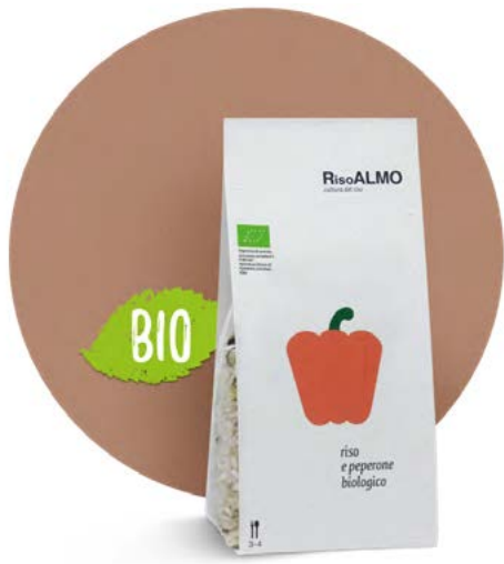
— peperone biologico — organic pepper