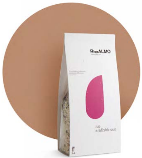
— radicchio rosso — red chicory