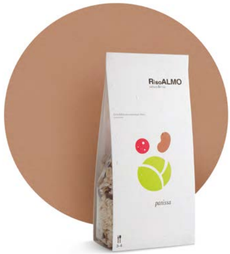
— panissa — panissa