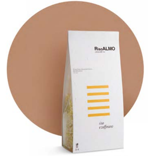
— zafferano — saffron