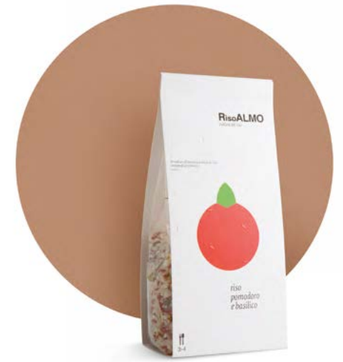
— pomodoro e basilico — tomato and basil