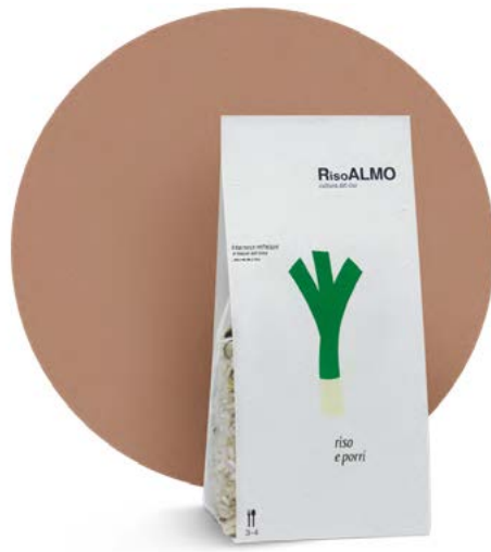
— porri — leeks