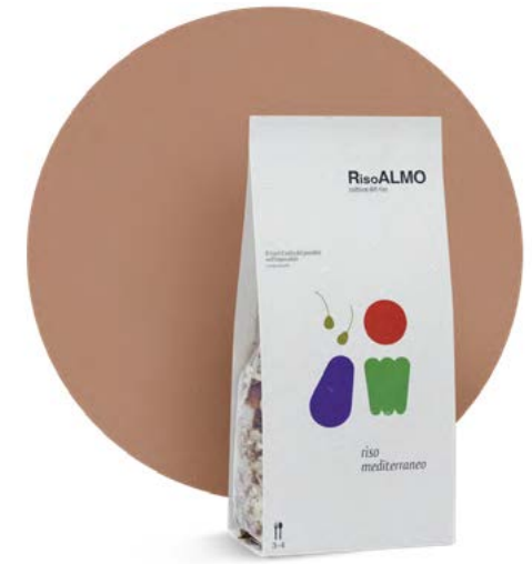
— mediterraneo — mediterranean