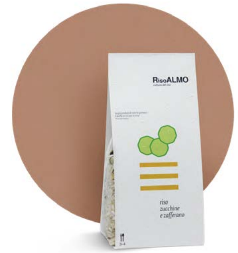
— zucchini e zafferano — zucchini and saffron