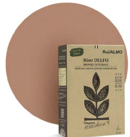
○ ————— delfo ————— ○