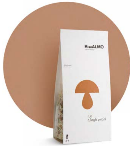
— funghi porcini — porcini mushrooms